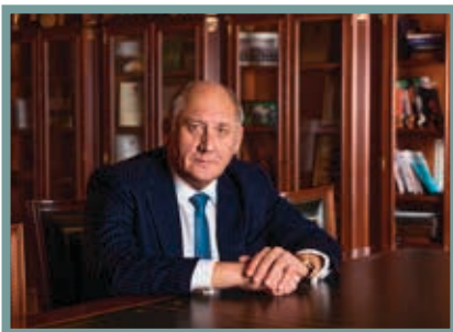
Александр Говорунов, вице-губернатор Санкт-Петербурга: