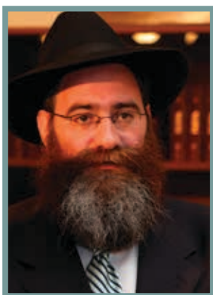
Менахем-Мендел Певзнер, главный раввин Санкт-Петербурга:

Не представляю себе жизни без женщин. Все равно, что без воздуха, без моря, без солнца... Это нереально. Для меня два года службы в Ансамбле песни Черноморского флота без женщин — это выброшенные годы.